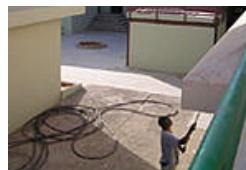
Interior del IES Puerto del Rosario.

Añaden que han redactado una carta al consejero de Educación, Isaac Godoy, donde piden que visite los centros para que conozca de primera mano la situación, así como la solidaridad del resto de centros educativos de la isla para que se consiga mejorar la situación educativa en Fuerteventura.