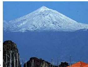
El padre Teide, sin paternidad artística.

La mezquita de Córdoba, por Andalucía; las cuevas de Altamira, por Cantabria; las murallas de Ávila, por Castilla León; el monasterio de El Escorial, por Madrid... ¿Y por Canarias? ¿Qué incluye la web del Ministerio de Cultura por Canarias dentro de la relación del patrimonio histórico español? ¿Qué va a ser? El Teide, por supuesto, el pico que un día labrara con pasión un aguerrido grupo de tinerfeños animados por algún editorialista iluminado y ansiosos de que, por alguna milagrosa conjunción de la naturaleza, una tremenda erupción acabara con la isla de enfrente. Y como se trata de patrimonio histórico y habría que añadirle el nombre del artista que lo parió, se abre un periodo de información pública a ver si alguien puede aportar la identidad de esos prohombres. Y los canariones que no se quejen, que peor hubiera sido designar las dunas de Maspalomas y colocarlas en Las Cañadas.